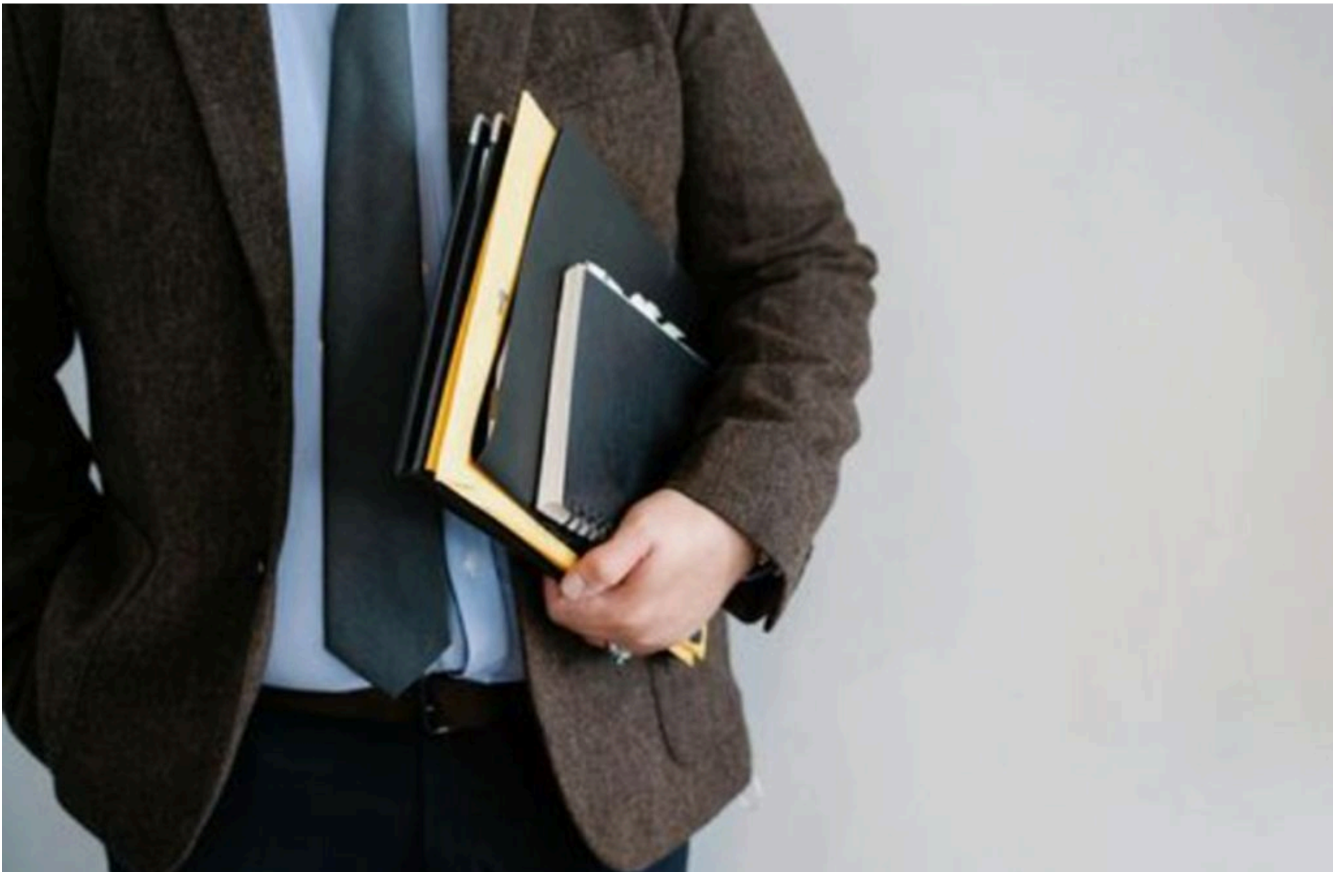
Держслужба / Фото з відкритих джерел

ЛИСЕНКО КАТЕРИНА — 07 Червня 2026, 16:16 1 Min Read — СУСПІЛЬСТВО