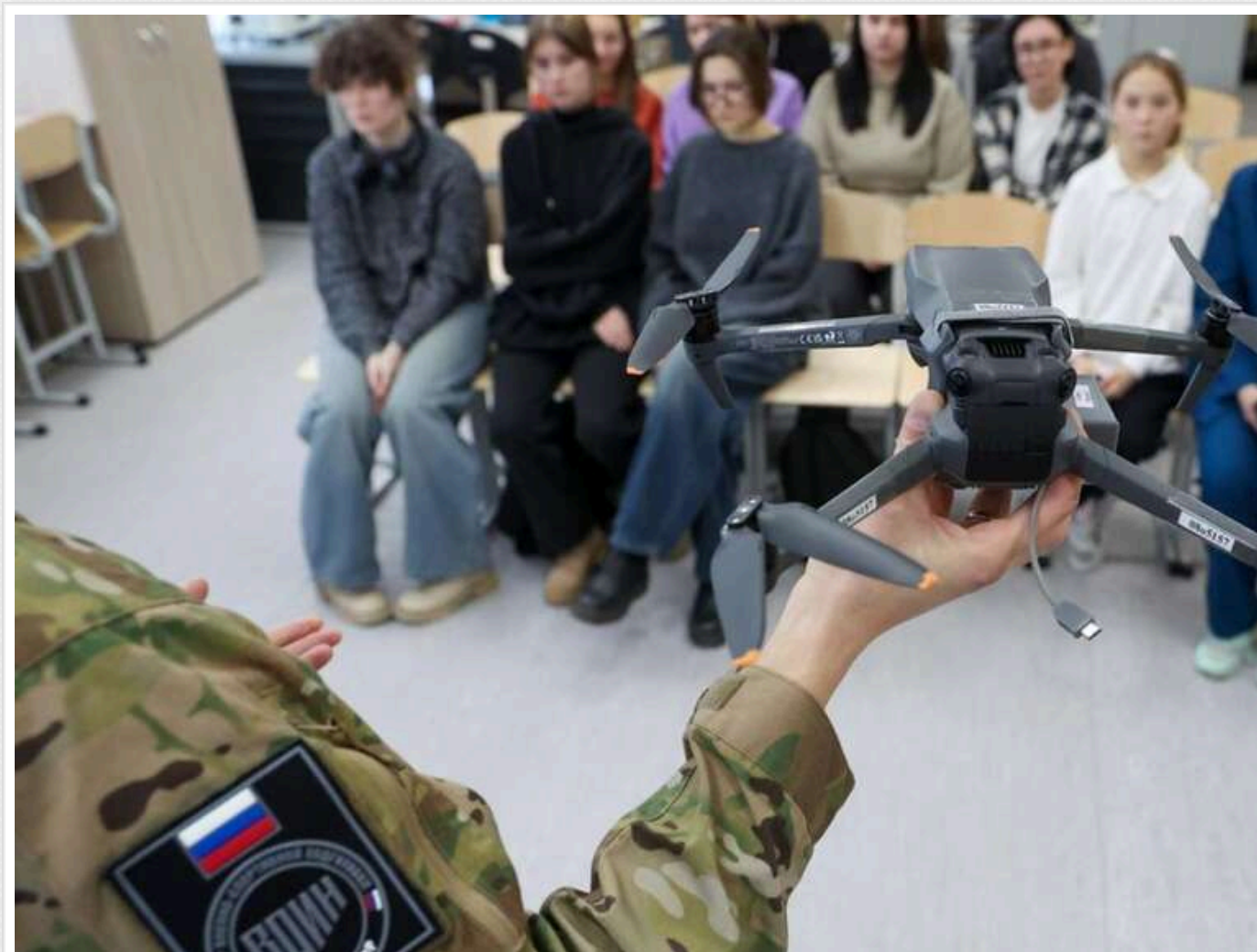
Кремль планує у 2026 році виділити майже 800 мільйонів доларів на мілітаризацію молоді, — ЦПД

У 2026 році російська влада планує виділити майже 800 мільйонів доларів на програми мілітаризації молоді.