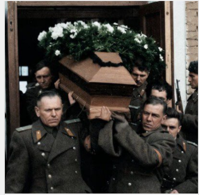
Секретна трагедія СРСР: як у ніч смерті Сталіна у Полтаві ..