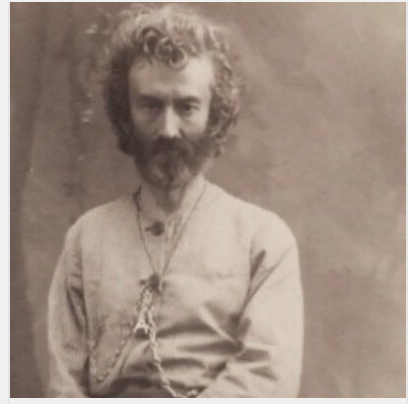
На Бесарабці у Києві пропонують встановити пам'ятник ..