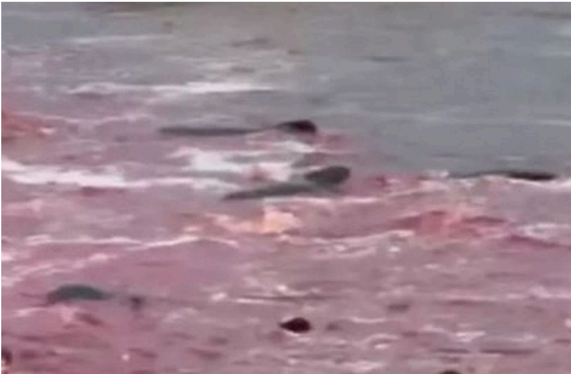
Фарерські острови