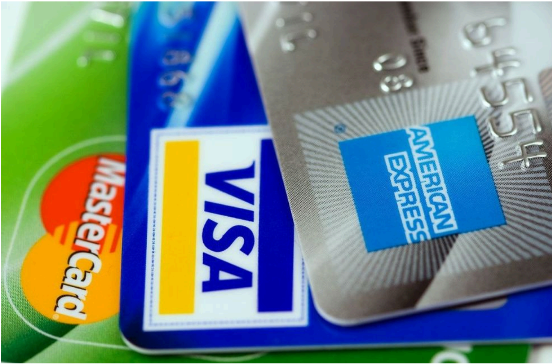
Банківська картка