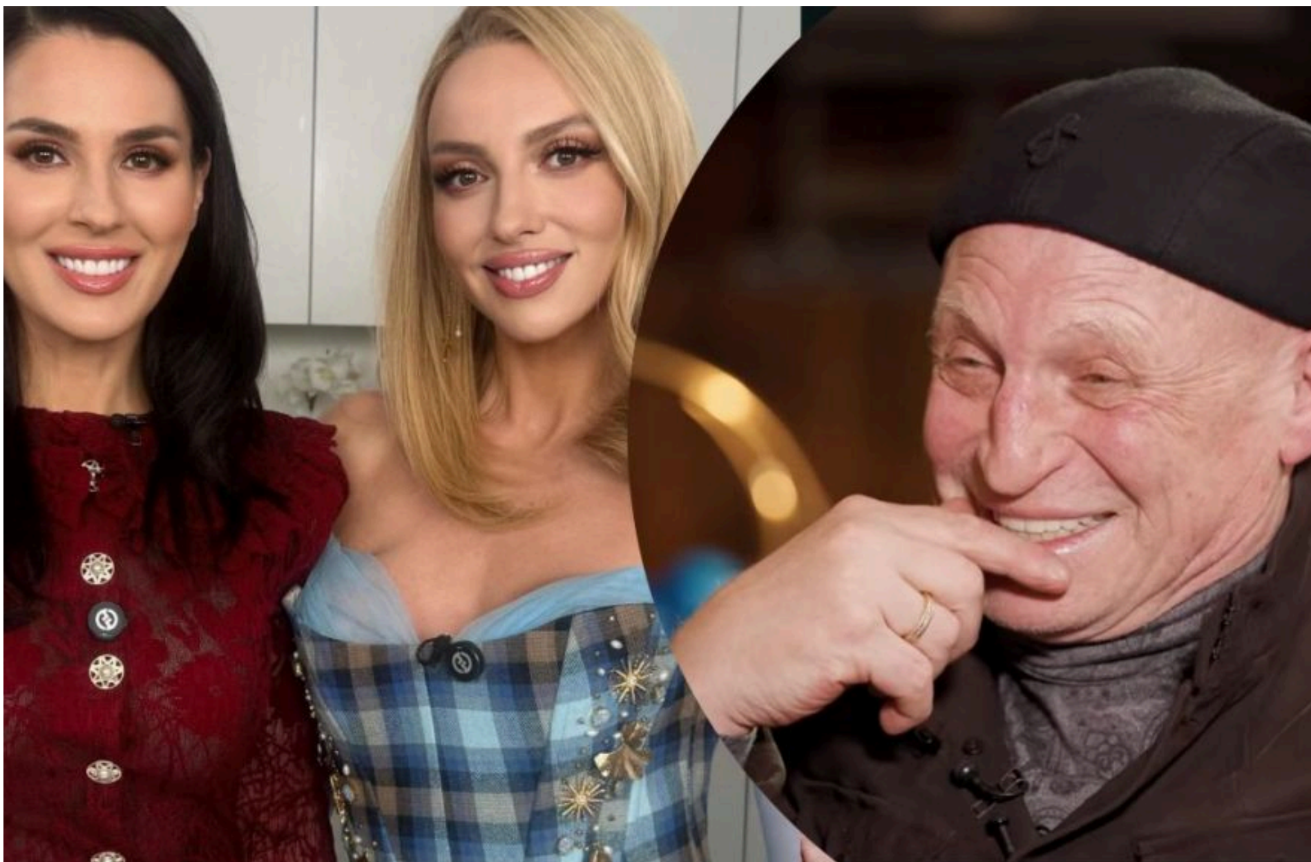
Маша Єфросиніна

СТЕПАНЕНКО ГРИГОРІЙ — 07 Червня 2026, 14:50 2 Mins Read — ГЛАМУР