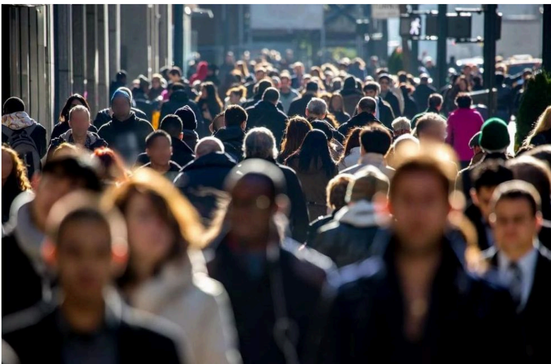
Населення Землі

ДМИТРУК АНДРІЙ — 07 Червня 2026, 14:56 2 Mins Read — НАУКА