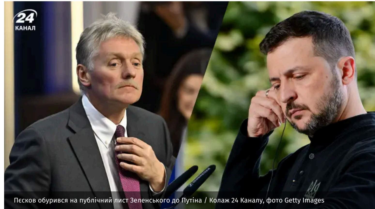
Песков обурився на публічний лист Зеленського до Путіна / Колаж 24 Каналу, фото Getty Images

Президент України Володимир Зеленський закликав Володимира Путіна припинити війну та розпочати прямі переговори щодо її завершення, оприлюднивши відкритий лист до російського диктатора. У Кремлі вкотре відреагували на звернення українського лідера та висловили своє невдоволення такою відкритою комунікацією.