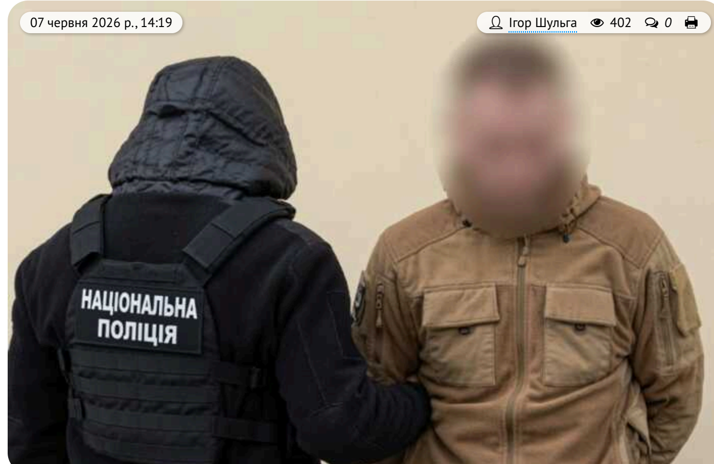
Замовив вбивство колишньої тещі: на Кіровоградщині суд виніс вирок чоловікові

Суд визнав винним військовослужбовця у замаху на умисне вбивство колишньої тещі, яку той звинувачував у своєму розлученні. Зловмисник організував пошук виконавця, передав йому інформацію про жертву та виплатив 11 тисяч гривень авансу. Спроба злочину була викрита правоохоронцями, які під час спецоперації інсценували вбивство.