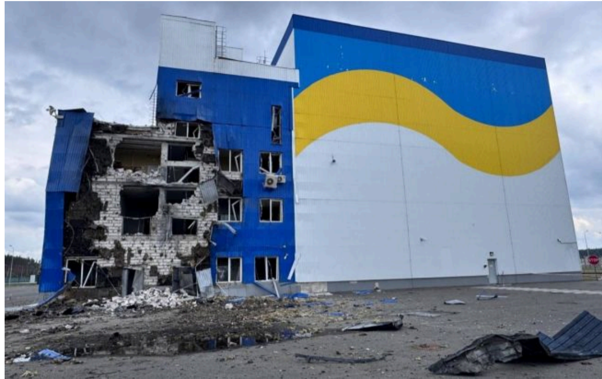
Фото: будівля Централізованого сховища відпрацьованого ядерного палива після атаки російського дрона