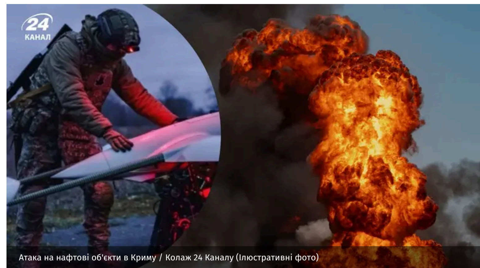
Атака на нафтові об'єкти в Криму / Колаж 24 Каналу (Ілюстративні фото)

Уночі проти 7 червня Сили спеціальних операцій здійснили низку ударів по нафтосквищах у Криму. Ціллю атаки стала, зокрема, нафтобаза "Семиколодезянська".