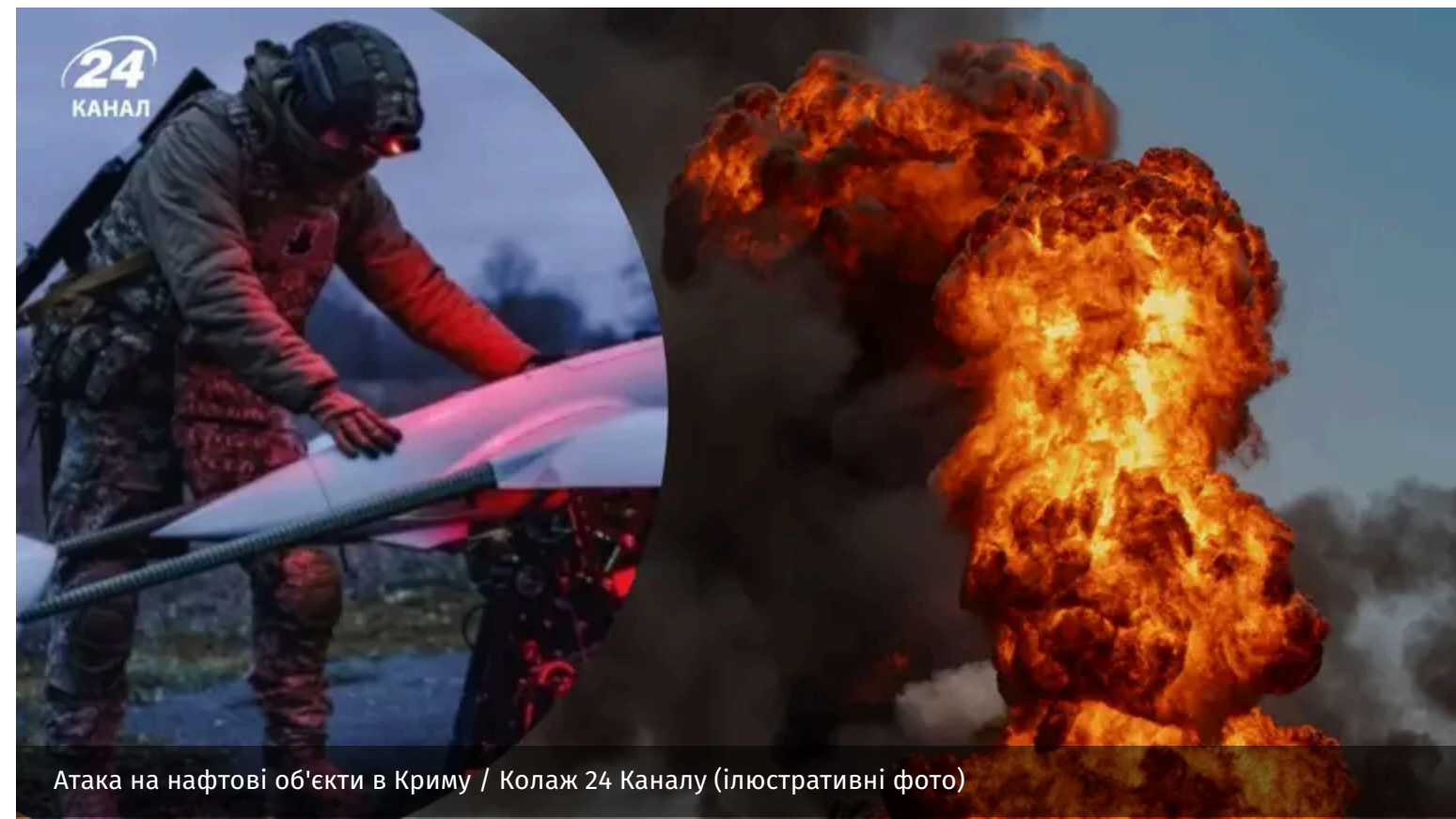
Атака на нафтові об'єкти в Криму / Колаж 24 Каналу (ілюстративні фото)

Уночі проти 7 червня Сили спеціальних операцій здійснили низку ударів по нафтосковищах у Криму. Ціллю атаки стала, зокрема, нафтобаза "Семиколодезянська".