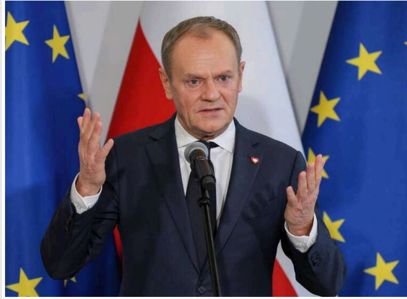
«Жорсткий бізнес замість емпатії»: Туск різко висловився про історичний конфлікт з Україною

Прем'єр-міністр Польщі Дональд Туск заявив, що відповідальність за врегулювання суперечки, пов'язаної з присвоєнням одному з підрозділів Збройних сил України імені «Героїв УПА», лежить на українській стороні.