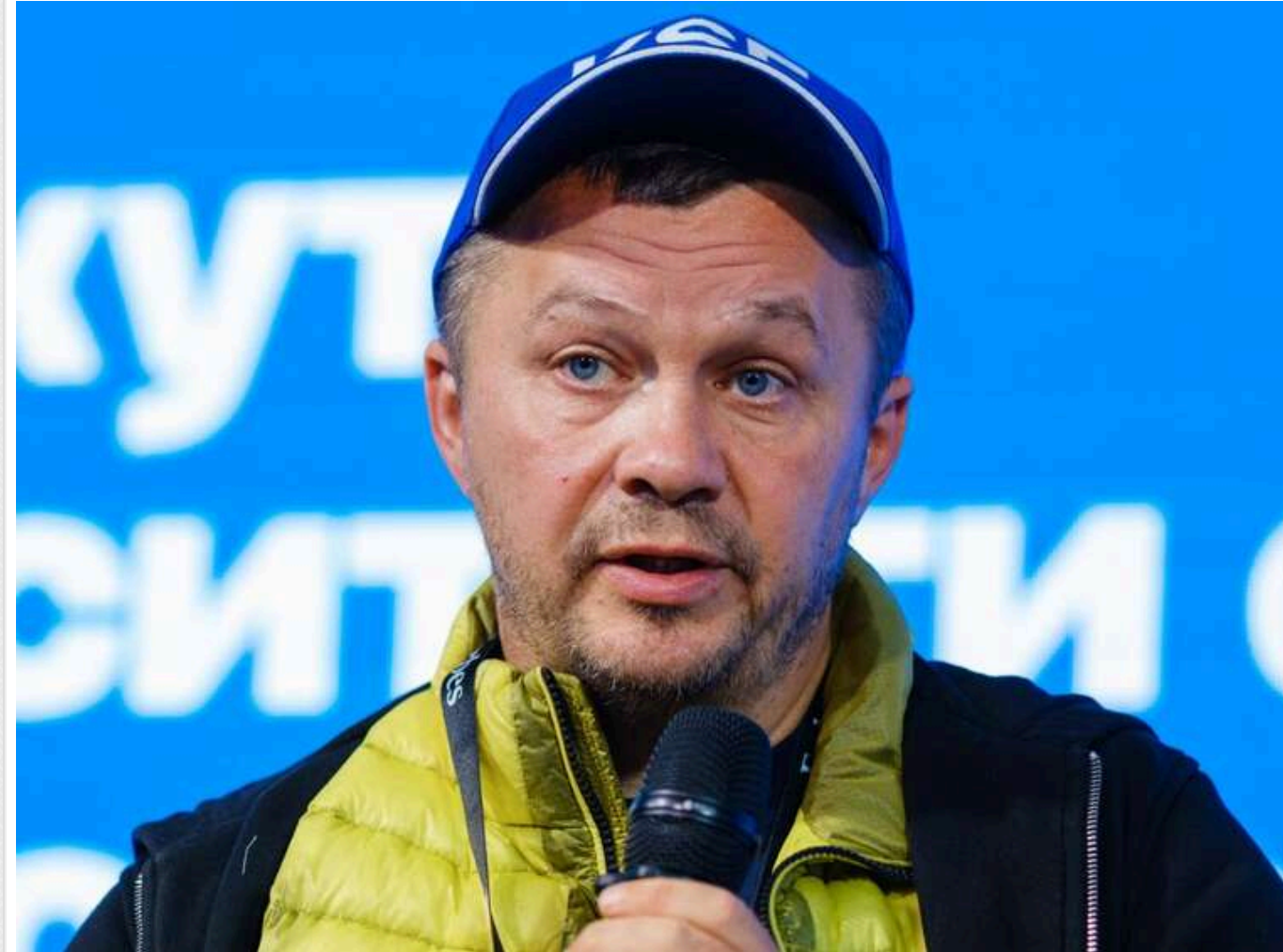
Голова КШЕ Милованов пройшов НМТ з математики і публічно показав свій «епічний провал»

Президент Київської школи економіки Тимофій Милованов пройшов демонстраційний варіант НМТ з математики та публічно поділився своїм результатом у соцмережах. За його словами, результат виявився не найвищим. Цей пост став частиною активної дискусії щодо законопроекту, який пропонує виключити математику з переліку обов'язкових предметів для вступу на певні спеціальності. Таким чином Милованов, імовірно, хотів підкреслити: навіть низький бал з математики у керівника економічного вишу не є підставою для скасування предмета як обов'язкового.