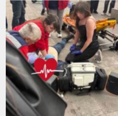
«А МИ ТУТ ПРИ ЧОМУ?». Смертельна відмова за п'ять хвилині від порятунку та ціна байдужості кміської підземки