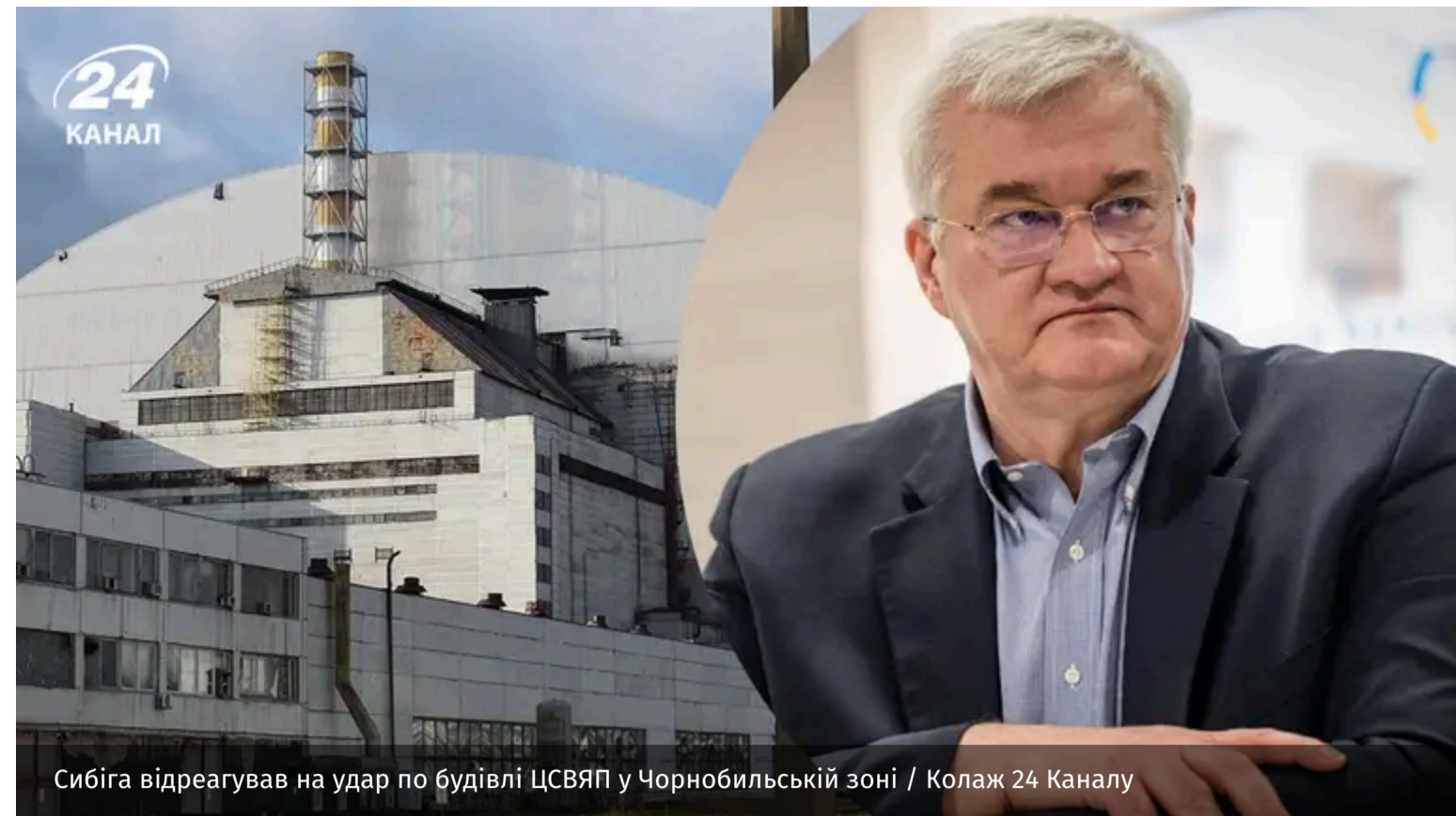
Сибіга відреагував на удар по будівлі ЦСВЯП у Чорнобильській зоні

Андрій Сибіга засудив російський удар по Централізованому сховищу відпрацьованого ядерного палива в Чорнобильській зоні. Міністр закордонних справ України вкотре закликав партнерів чинити більший тиск на країну-агресорку.