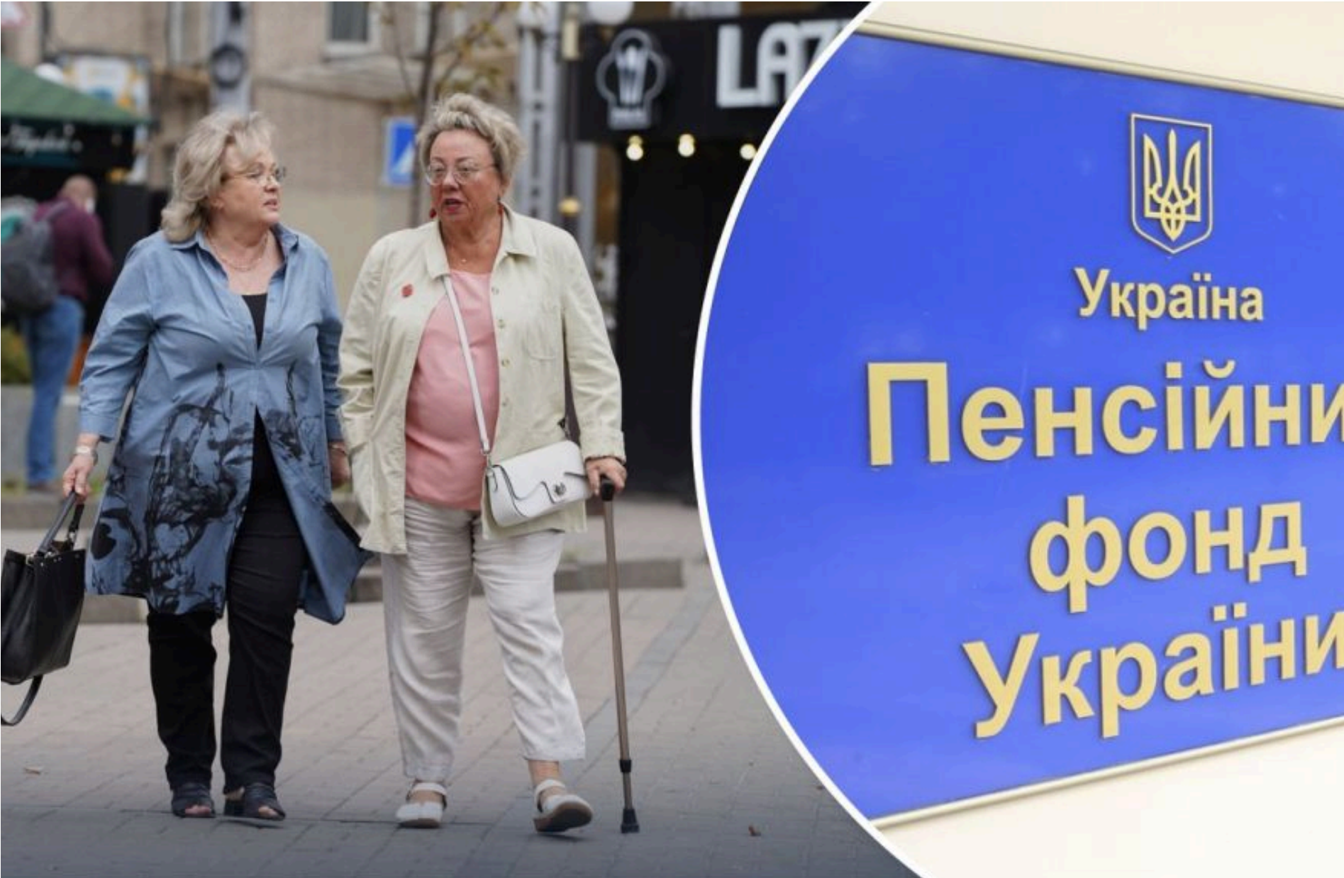
Пенсія / Фото з відкритих джерел

ЛИСЕНКО КАТЕРИНА — 07 Червня 2026, 10:32 2 Mins Read — СУСПІЛЬСТВО