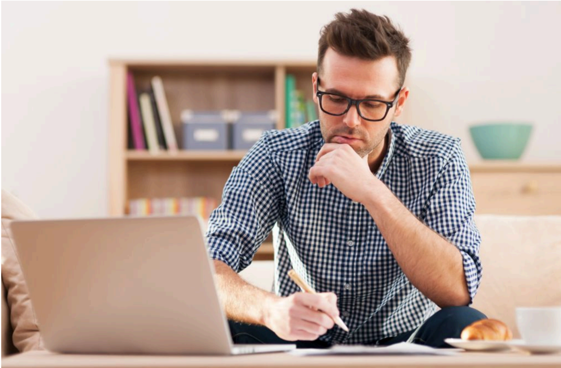
ФОП / Фото з відкритих джерел