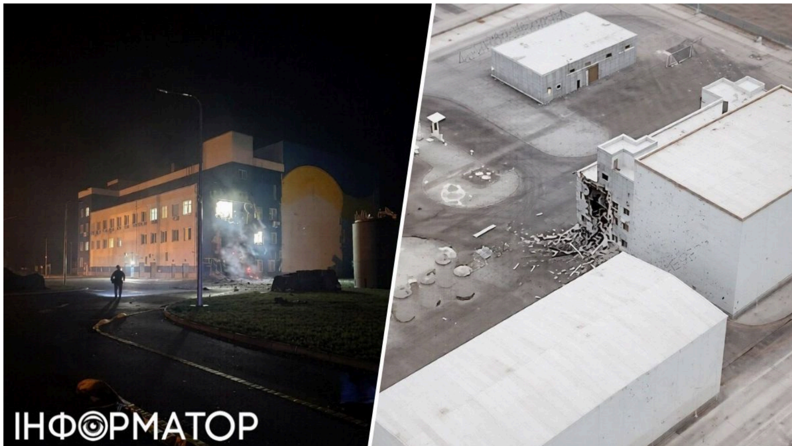
РФ вдарила по сховищу ядерного палива

Росія 7 червня завдала удару безпілотником по майданчику Централізованого сховища відпрацьованого ядерного палива, яке знаходиться у Чорнобилі. Запорізька АЕС нещодавно зазнавала обстрілів – тепер знову атаковано об'єкт ядерної інфраструктури. Постраждалих серед персоналу немає, радіаційний фон на майданчику залишається в межах норми.