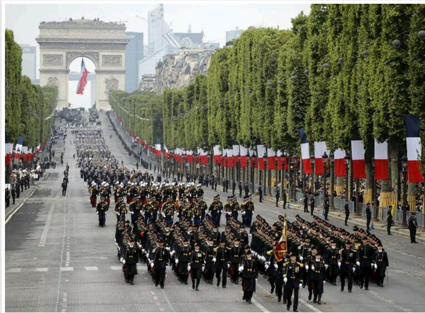
Парад на День взяття Бастилії в Парижі присвяжать Україні та протидії російській агресії

Цьогорічний традиційний військовий парад у Франції з нагоди Дня взяття Бастилії, який відбудеться 14 липня, буде присвячений підтримці України та демонстрації готовності Заходу протистояти російській агресії.