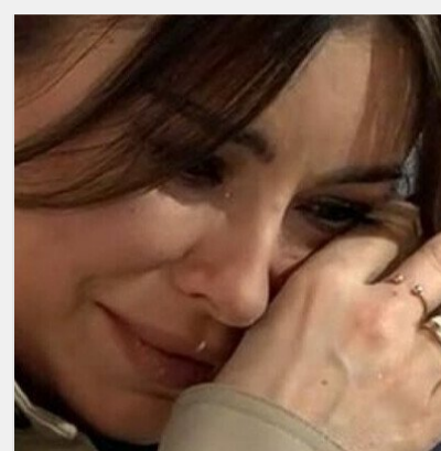
Хотіла всидіти на двох стільцях, а тепер не потрібна ..