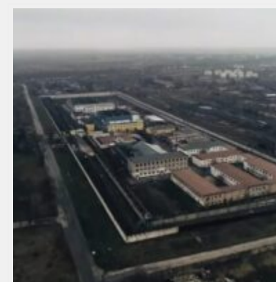
Російські загарбники перетворили Бердянську колонію № 77 на катівню для українців