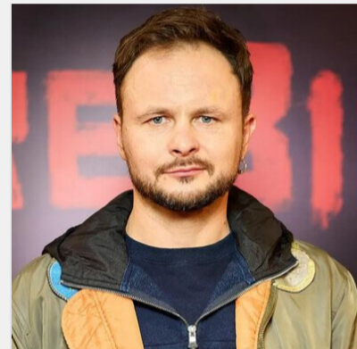
Зірку серіалу "Спіймати Кайдаша" заскочили за кермом таксі, ..