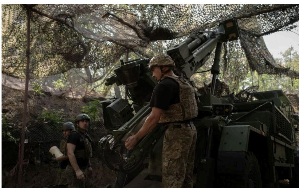
Фото: у травні Україна звільнила більше територій, ніж захопила Росія