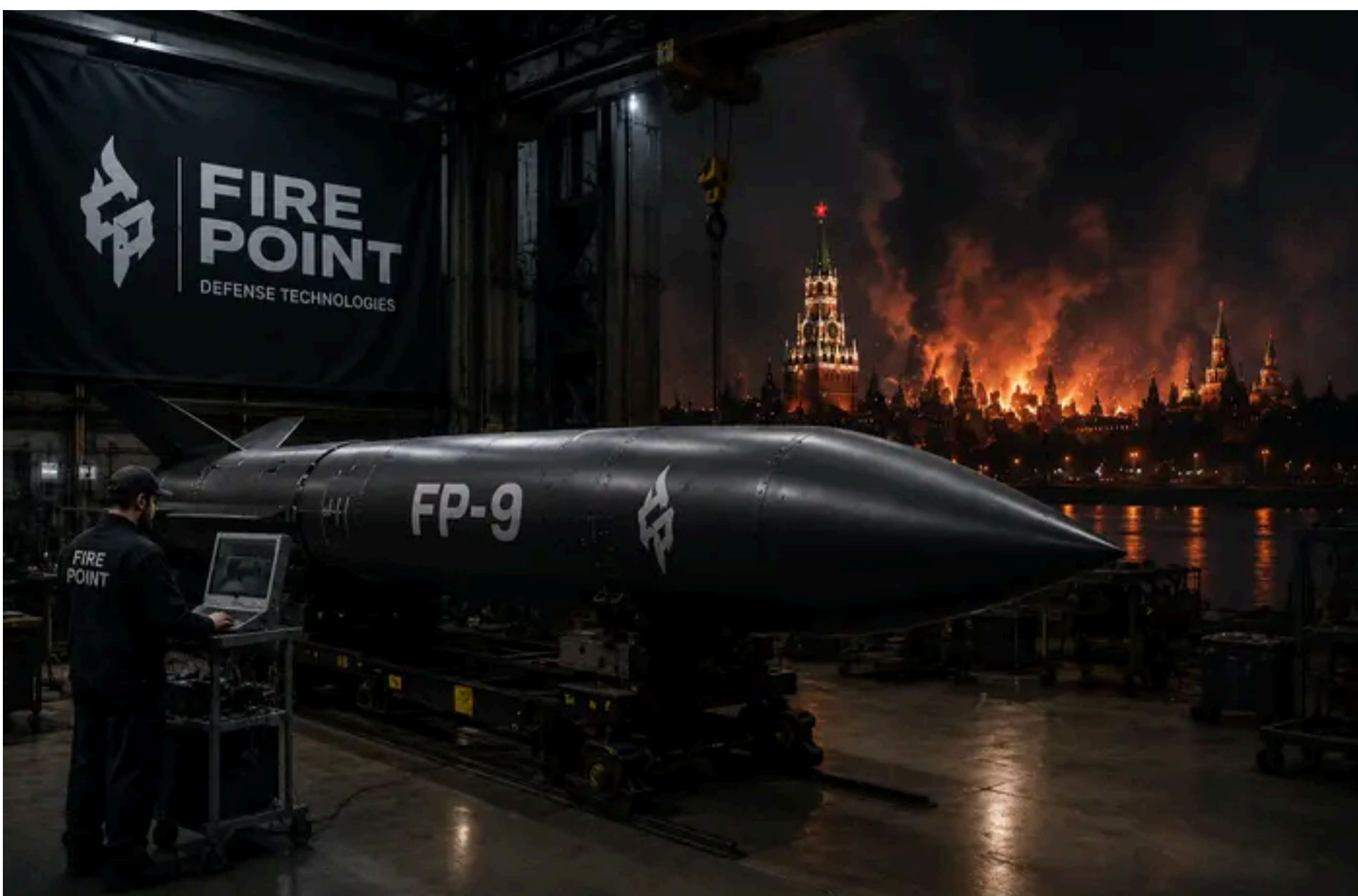
Fire Point / Фото з відкритих джерел

КАРПЕЦЬ ОЛЕКСАНДР — 07 Червня 2026, 09:15 ⌚ 2 Mins Read — АРМІЯ І ЗБРОЯ