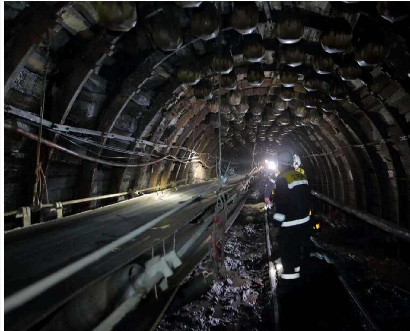
Замість вугілля – теплиці: Пушилін запропонував вирощувати овочі в закритих шахтах Донбасу

Постійна температура в покинутих вузільних шахтах може бути використана для організації теплиць: закриті шахти матимуть полит як у найближчій перспективі, так і після завершення «СВО».