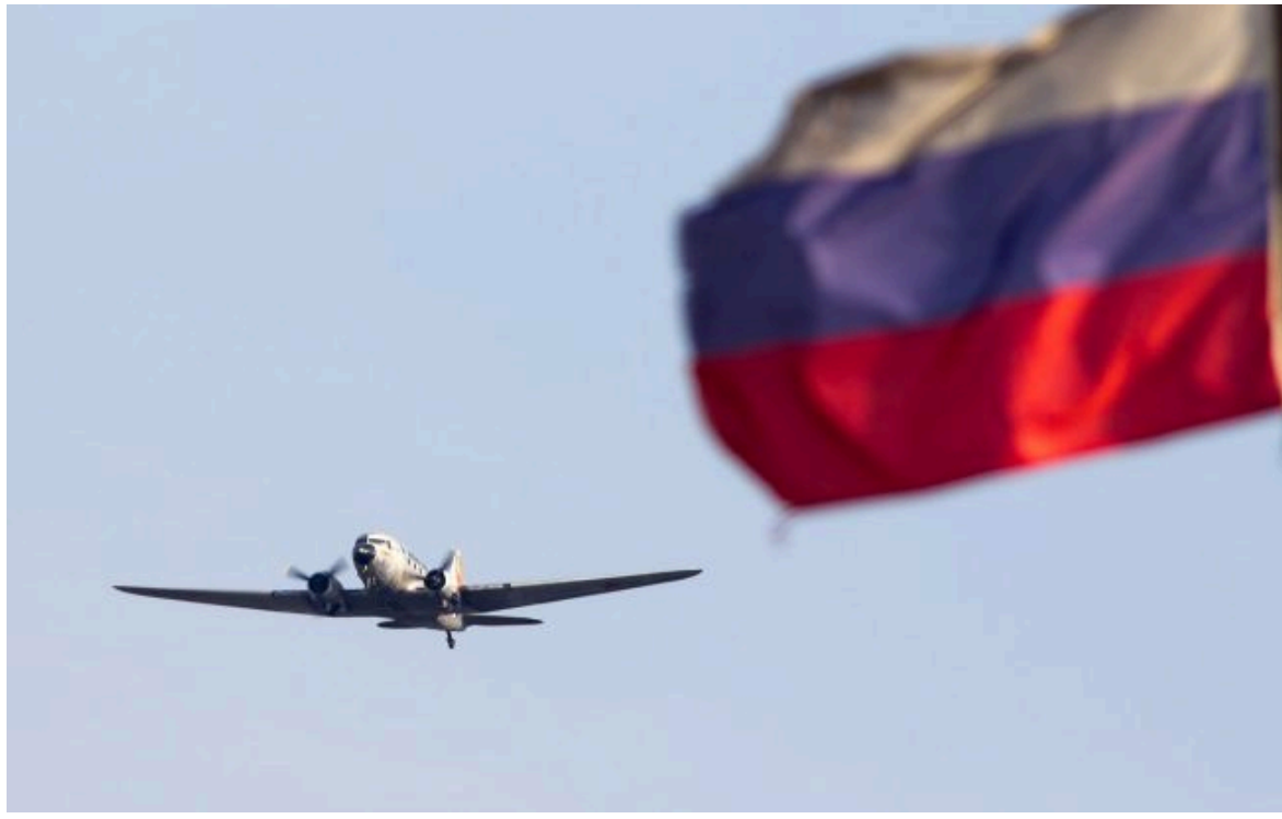
Фото: олігархи РФ продовжують літати на крутих джетах (flickr.com)