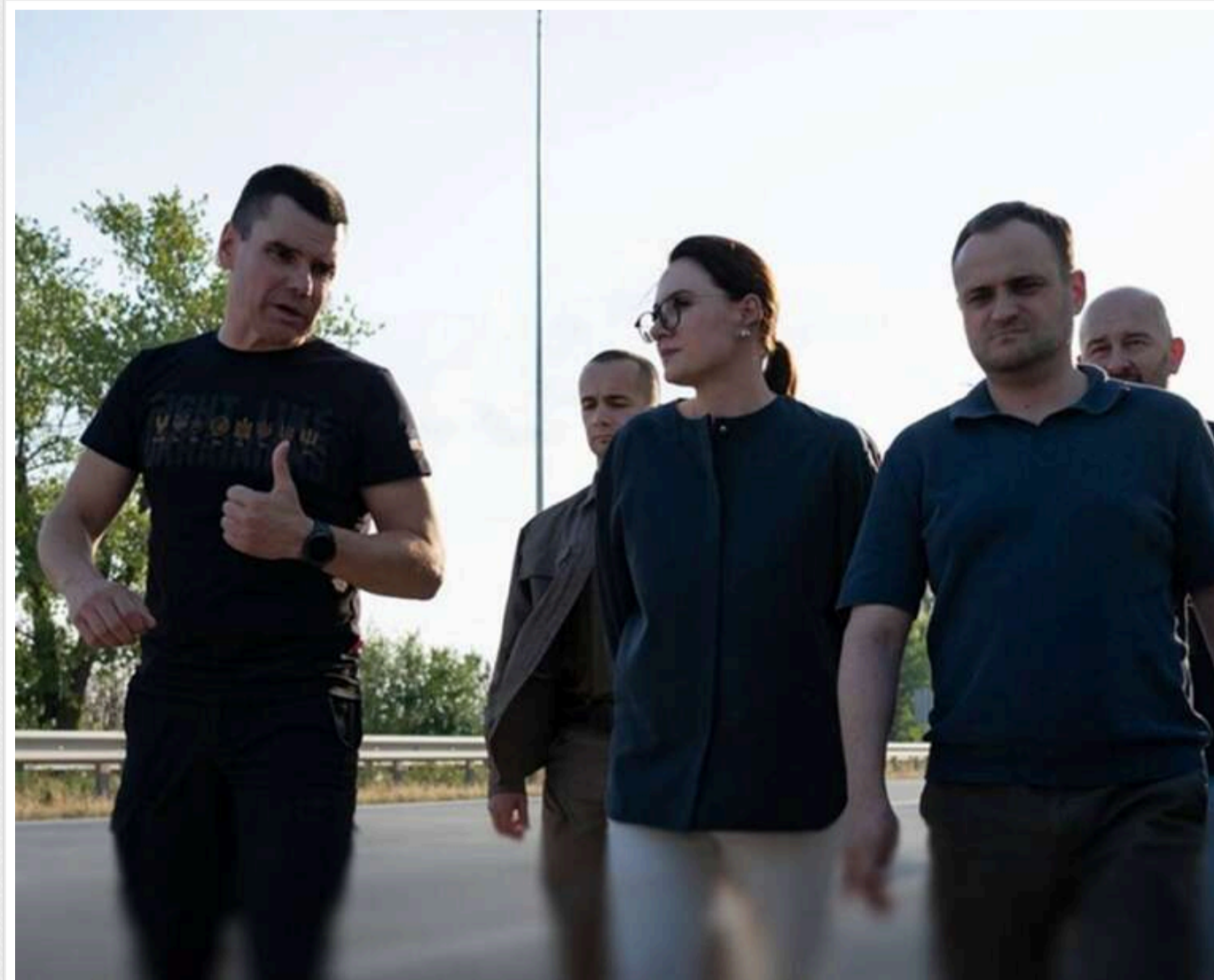
Кабмін виділив 3,5 мільярди гривень на терміновий ремонт доріг місцевого значення

В Україні невідкладно відремонтують критичні ділянки доріг місцевого значення. На це виділяють мільярди гривень з державного бюджету.