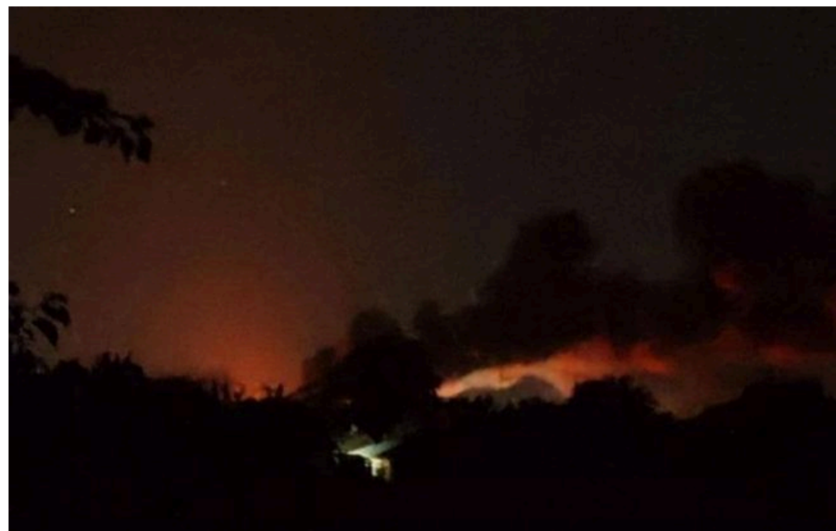
Фото: пожежа після атаки дронів