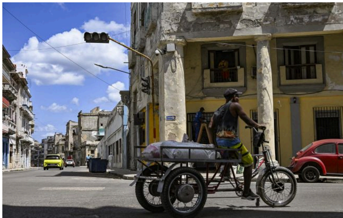
Фото: на острові спостерігається масовий відтік мігрантів (Getty Images)