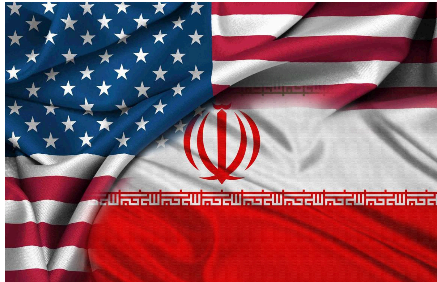
Радник Хаменеї висуває умову США для мирної угоди з Іраном

Потенційна ескалація може торкнутися Ормузької протоки, Індійського океану, Баб-ель-Мандебської протоки, Червоного та навіть Середземного морів.