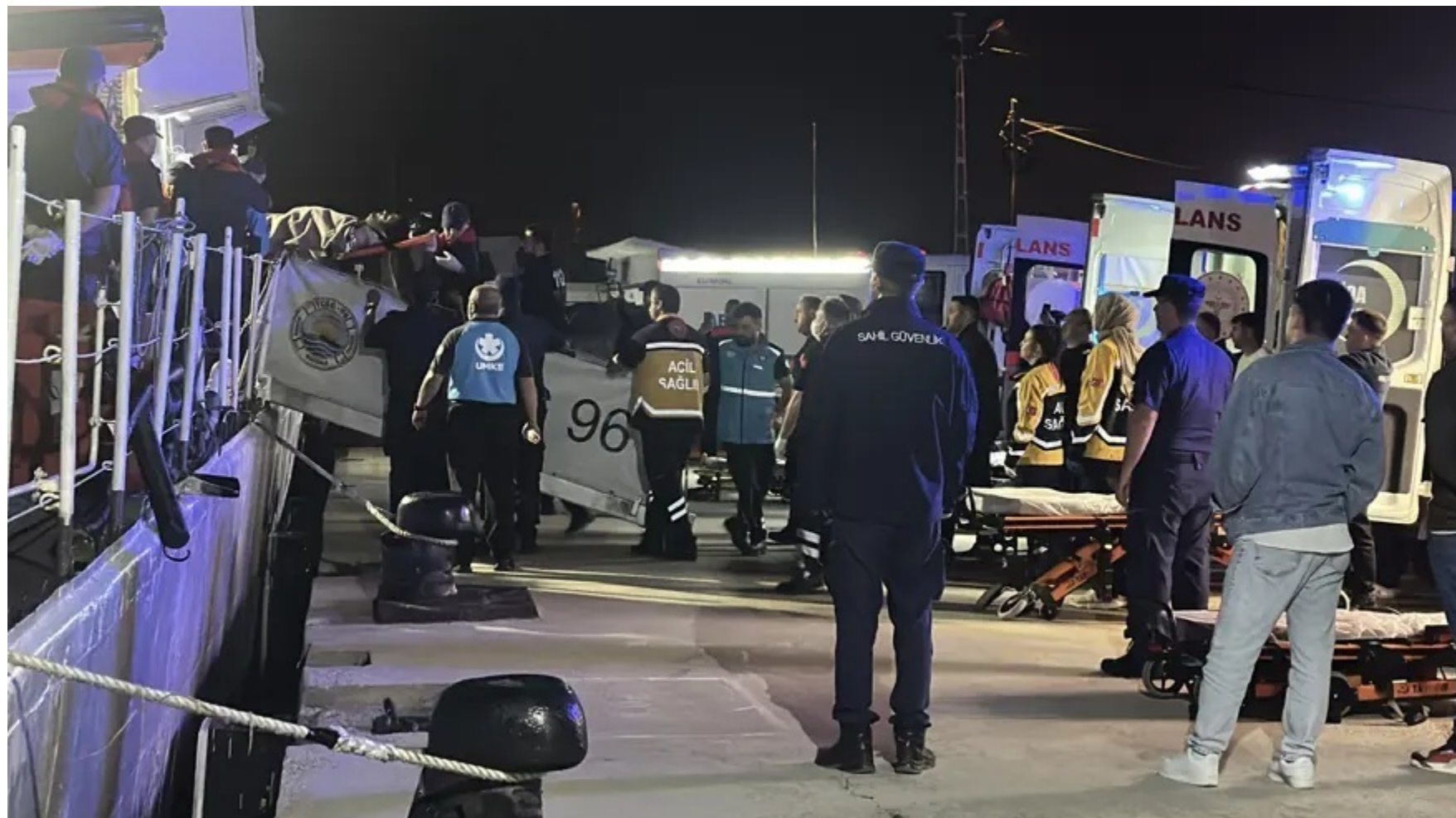
Евакуація поранених рибалок та тіла загиблого з борту корабля берегової охорони Туреччини TCSG-96 в порту Інеболу.

О 19:20 корабель прибув до рибальського судна Burak Kaya, яке знаходилося на відстані 115 морських миль на північ від порту Інеболу в межах турецької зони пошуково-рятувальних операцій. Тіло загиблого рибалки та поранених підняли на борт TCSG-96. Пораненим було надано медичну допомогу, після чого корабель вирушив у порт Інеболу.