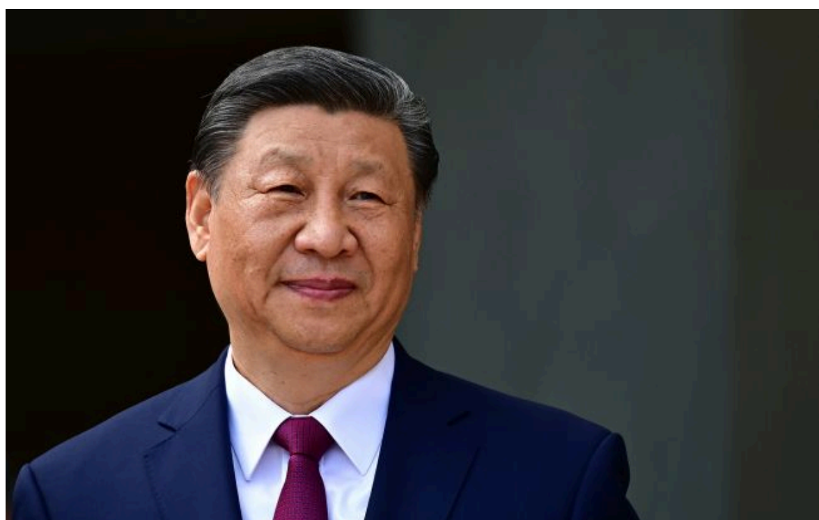
Фото: лідер Китаю Сі Цзіньпін