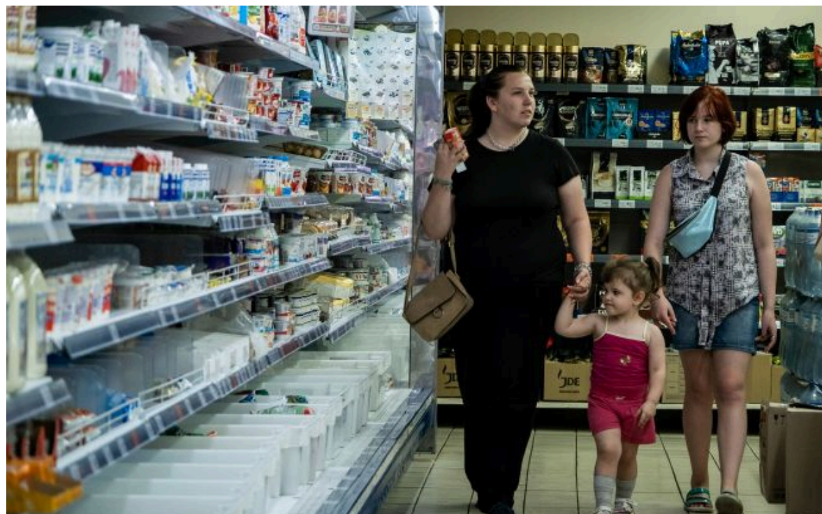
Фото: на інцидент вплинули два фактори (Getty Images)