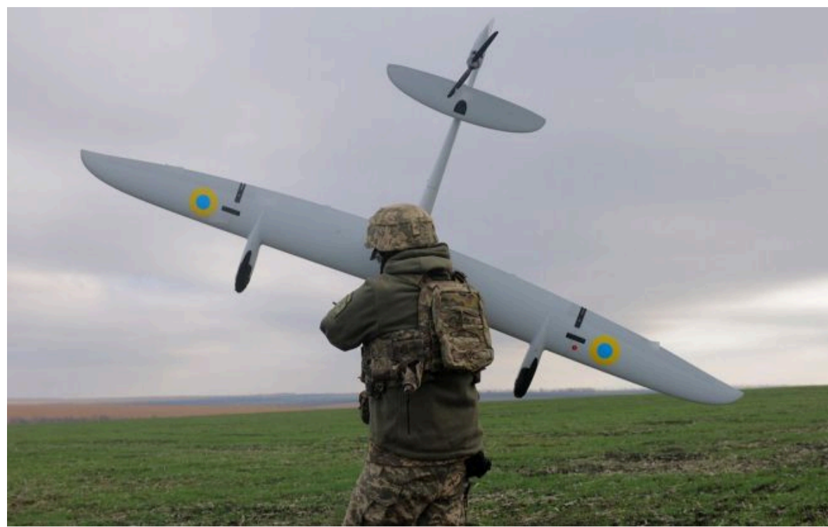
Фото: ЗСУ уразили низку важливих цілей ворога