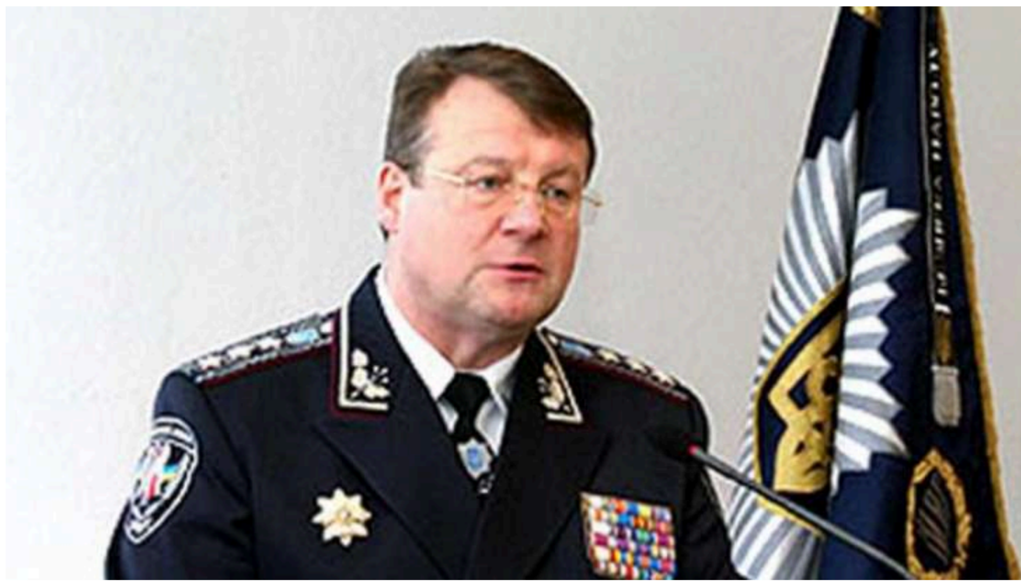
Фото: Володимир Бедриківський

У Польщі затримали за підозрою у пропозиції хабаря державному службовцю українського генерал-полковника у відставці Володимира Бедриківського, який був заступником ексглави МВС України Юрія Луценка. Про це пише польське видання TVP World з посиланням на речника Національної прокуратури Польщі Пшемислава Новака.