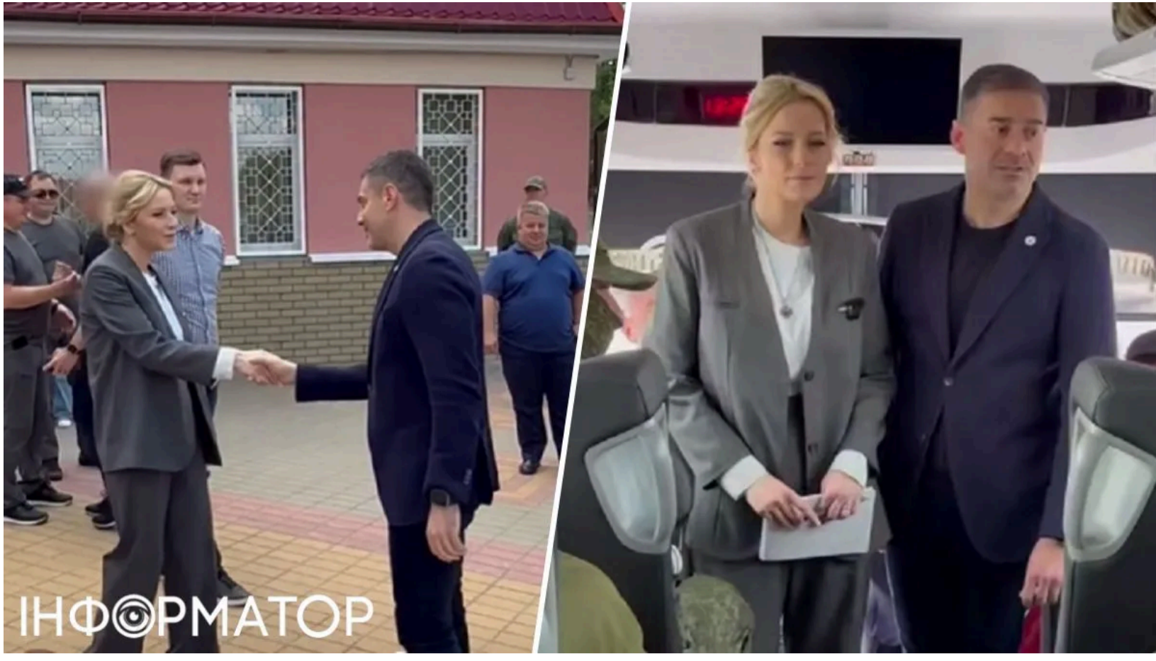
Лубінець вперше зустрівся з новою російською омбудсменкою