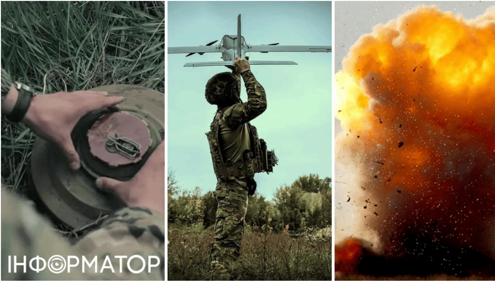
СБС вдарили по базі саперного полку РФ

Сили безпілотних систем ЗСУ вночі завдали масованого удару по базі 90-го саперного полку Росії в окупованому Піонерському на Донеччині. Водночас "птахи" СБС атакували судна в портах Маріуполя та Бердянська - зафіксовано ураження п'яти суховантажів та танкера. Окупанти задіяли ці судна для перевезення вантажів через захоплені порти Азовського моря.