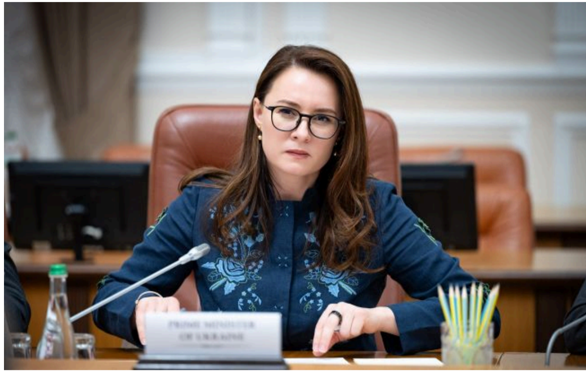
Фото: прем'єр-міністерка України Юлія Свириденко (facebook.com/KabminUA)

Не витрачай час на шум! Читай тільки суть з РБК-Україна у Google