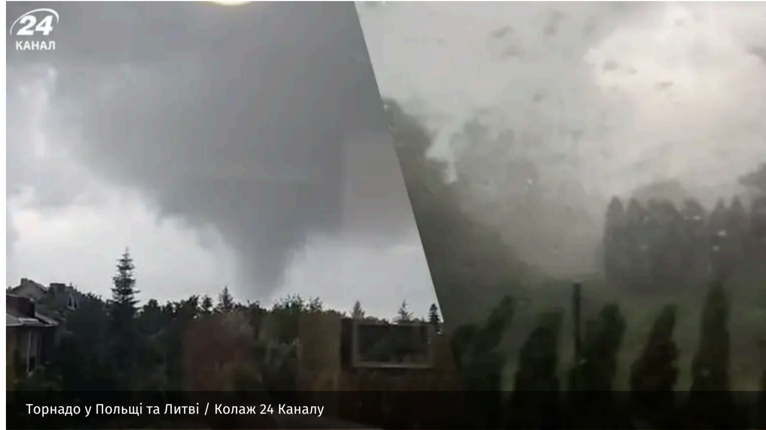
Торнадо у Польщі та Литві

У Польщі 5 червня селом Цуднохи пронеслося торнадо. Схожа негода накрила й литовські міста, де зафіксували три смерчі.