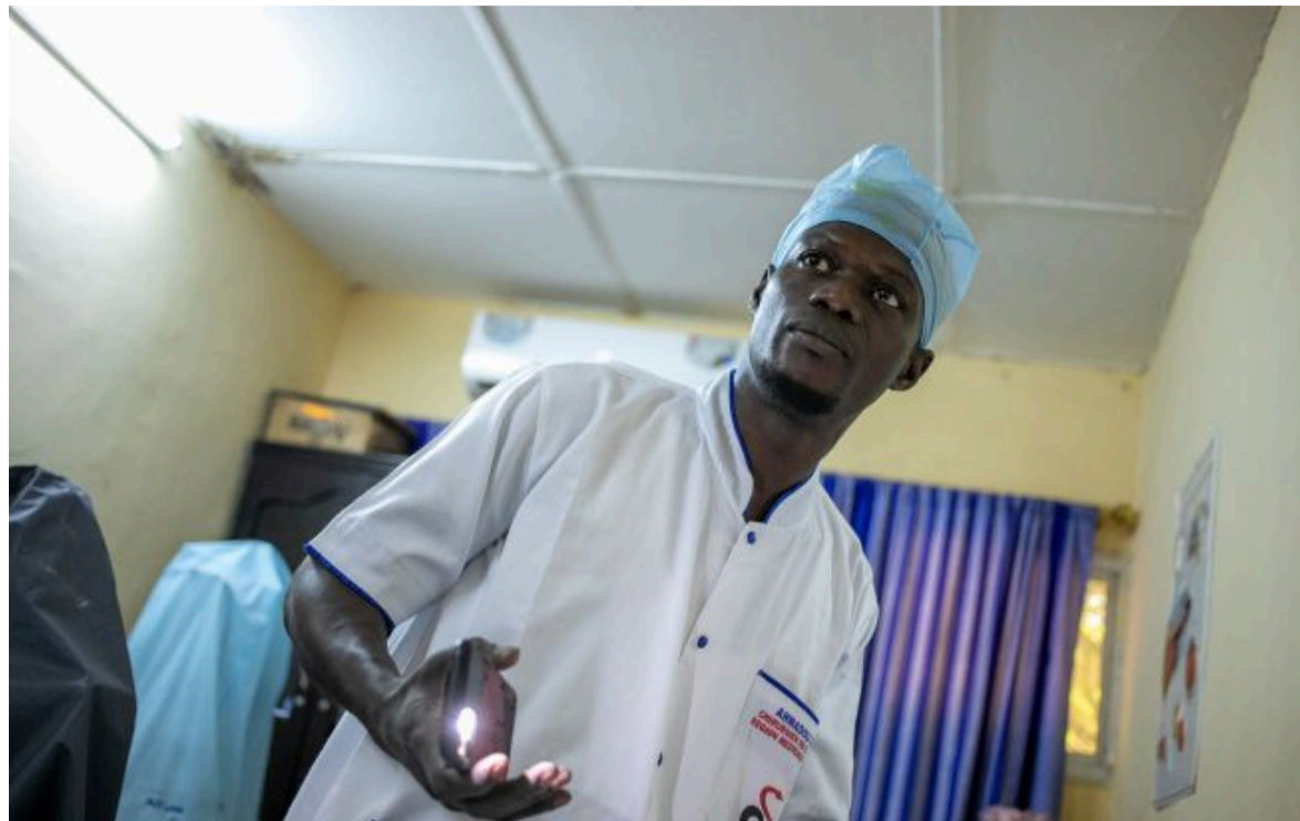
Фото: у ВООЗ дали тривожний прогноз щодо Еболи (Getty Images)