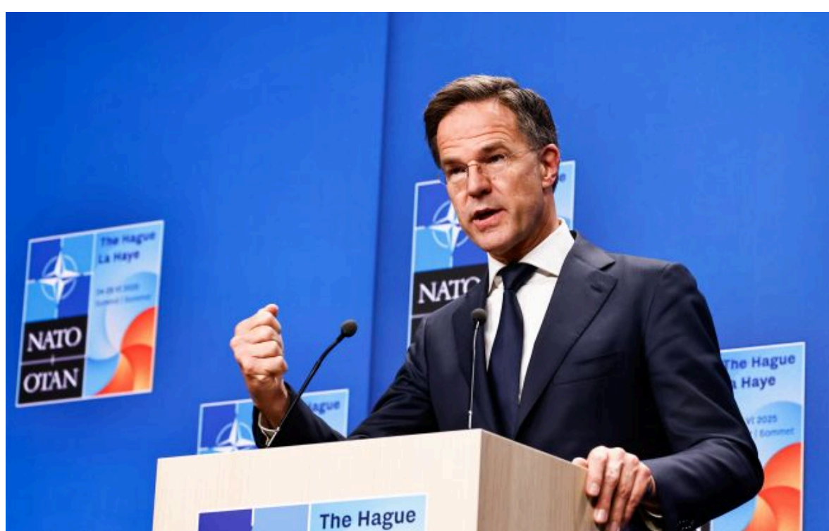
Фото: генсек НАТО Марк Рютте (Getty Images)