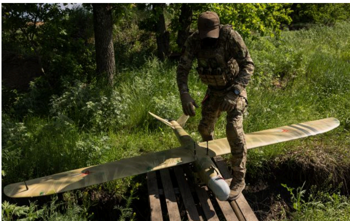
Фото: ЗСУ уразили низку важливих об'єктів окупантів