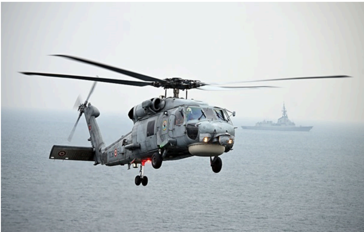
Фото: Getty Images (ілюстративне)

Нова Зеландія може отримати американські вертольоти на $1,5 млрд