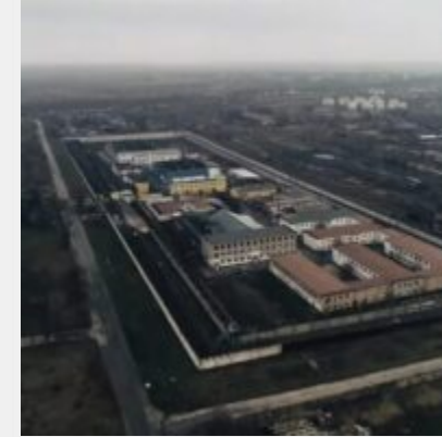
Російські загарбники перетворили Бердянську колонію № 77 на катівню для українців