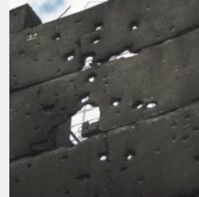
Як виглядає українська ТЕЦ, що пережила не одну ракетну атаку російських загарбників