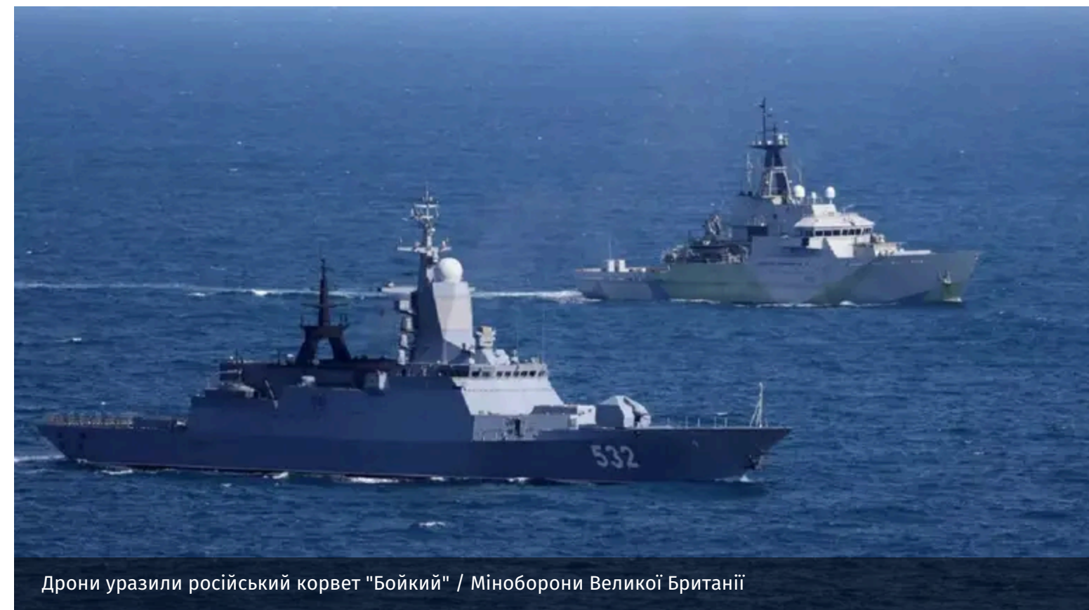
Дрони уразили російський корвет "Бойкий"

Українські дрони атакували Кронштадтську військово-морську базу. Зокрема, там уразили російський корвет "Бойкий". Демілітаризація та ослаблення Росії продовжується.