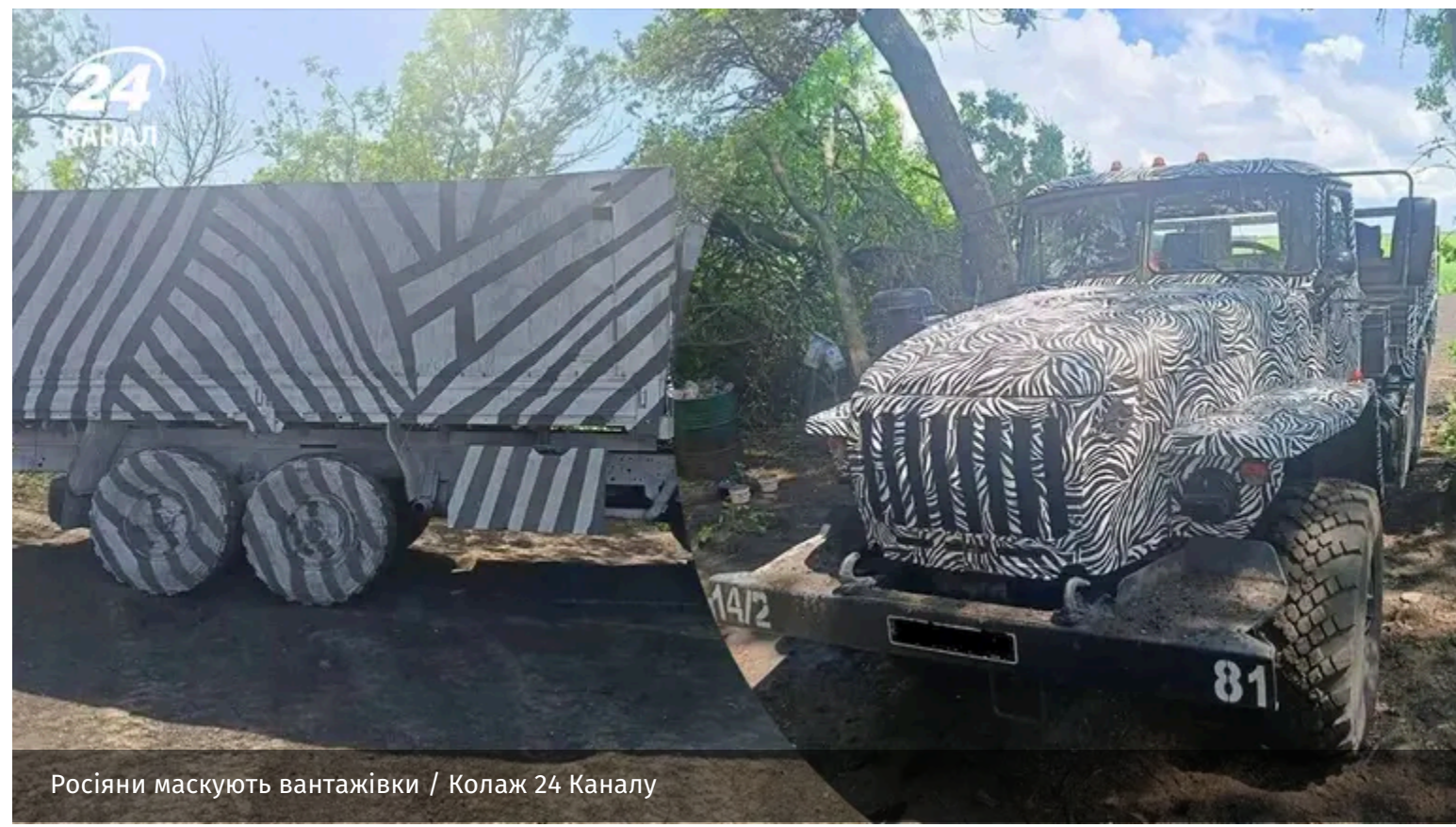
Росіяни маскують вантажівки

Так звана траса "Новоросія", яка веде з Криму до Маріуполя, Таганрога і Ростовської області, опинилася під вогневим контролем українських БПЛА. Тому окупанти маскують вантажівки зебрподібним смугастим камуфляжем. Навіть колеса фарбують у чорно-білий.