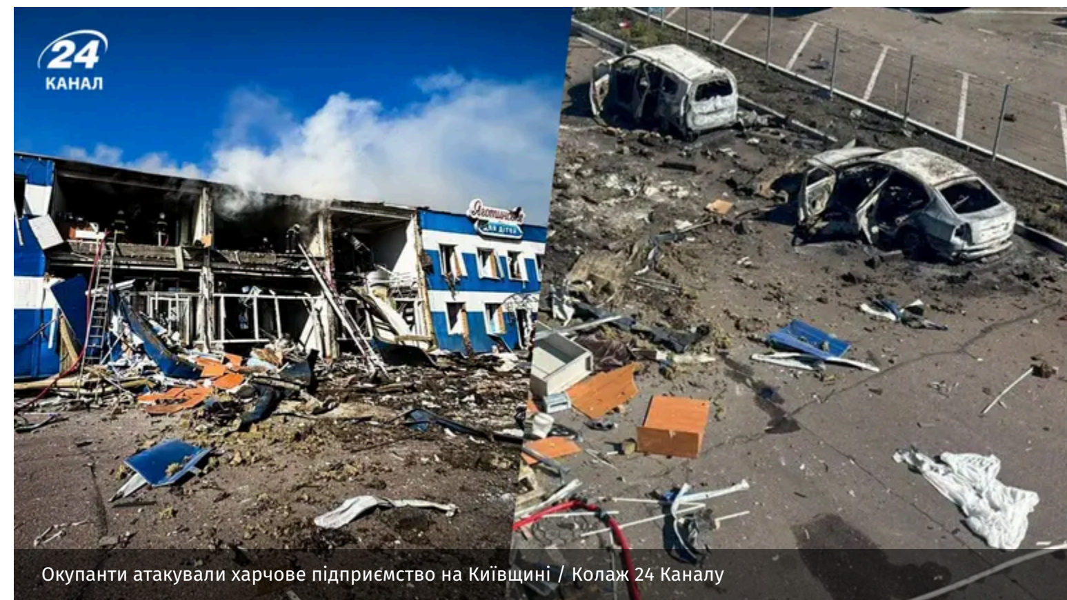
Окупанти атакували харчове підприємство на Київщині