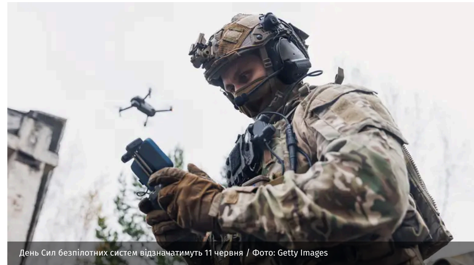
День Сил безпілотних систем відзначатимуть 11 червня

В Україні 11 червня стане Днем Сил безпілотних систем – військових, які знищують ворога та демонструють світу силу української інженерної думки.