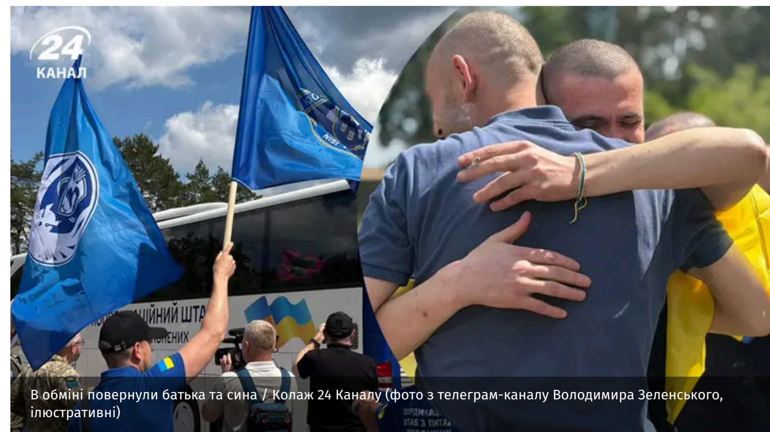
В обміні повернули батька та сина

Між Росією та Україною 5 червня відбувся новий обмін полоненими. Додому вдалося повернути рідних батька та сина, які захищали нашу державу на фронті.