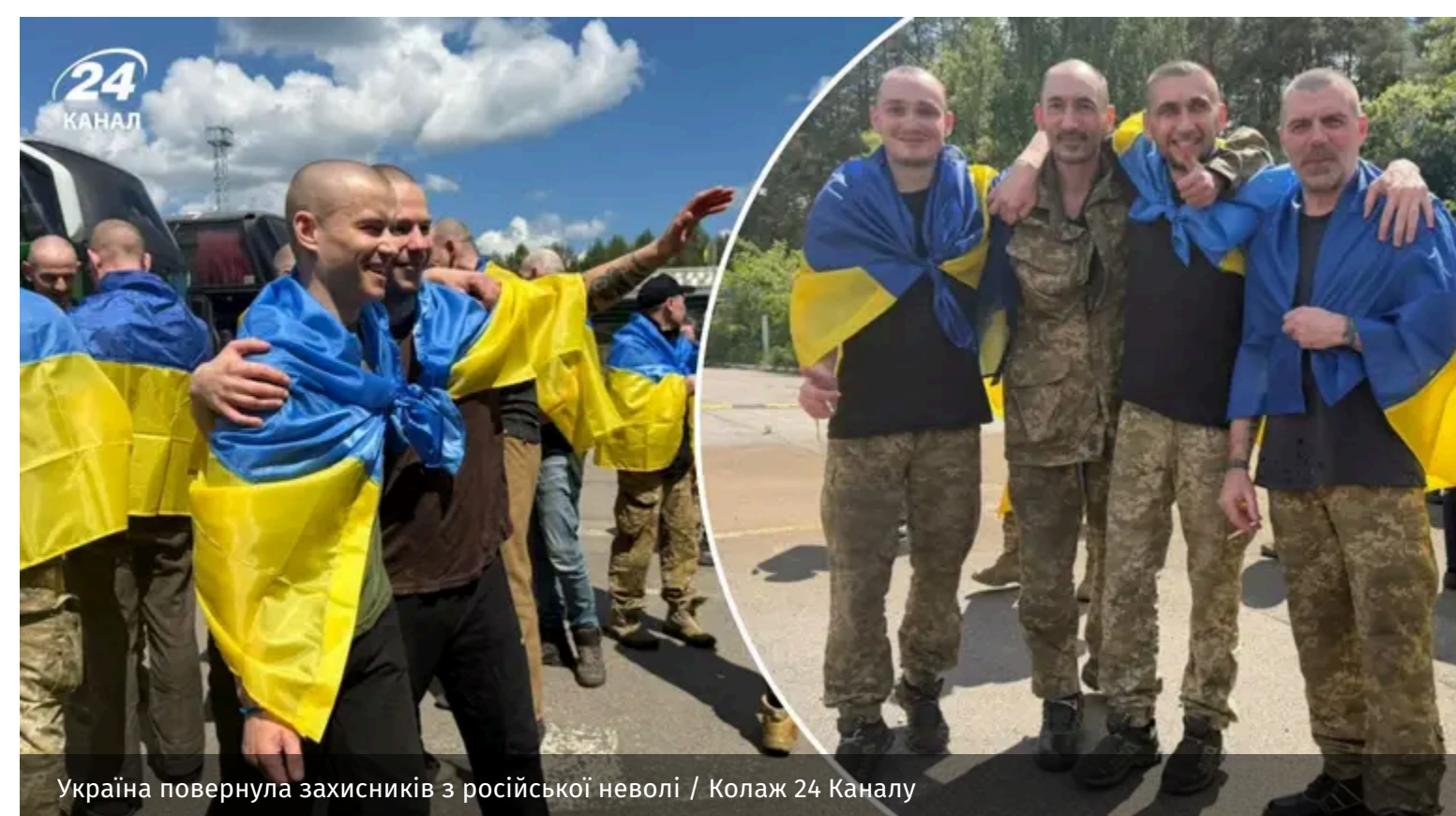
Україна повернула захисників з російської неволі

Україна провела черговий обмін полоненими, внаслідок якого додому повернулися 185 військовослужбовців і один цивільний. Серед звільнених – захисники Маріуполя, "Азовсталі" та різних напрямків фронту, які перебували в полоні з 2022 року.