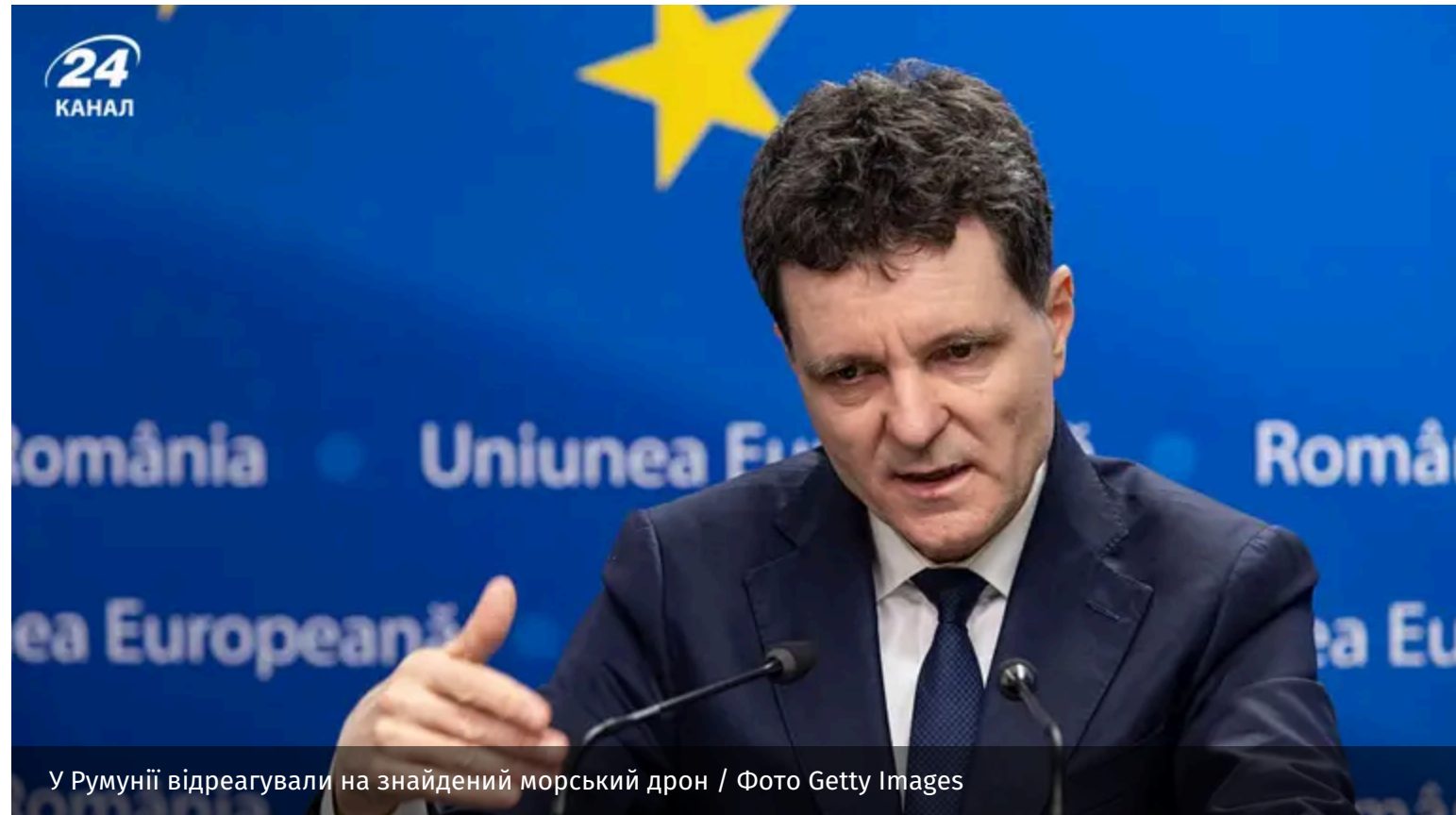
У Румунії відреагували на знайдений морський дрон

Президент Румунії Нікушор Дан прокоментував вибух морського дрона в порту Констанци. Він наголосив, що цей інцидент є прямим наслідком війни Росії проти України.